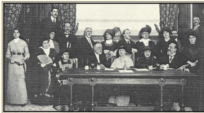
Reunión de distinguidas personalidades en el Congreso de los Diputados para tratar la campaña en pro del ingreso de la escritora Emilia Pardo Bazán en la Real Academia Española.

Así lo relataba "La Ilustración Artística": "Tiempo hace que las más altas representaciones de la intelectualidad española vienen sosteniendo una campaña en pro del ingreso en la Real Academia de la eximia escritora condesa de Pardo Bazán; pero hasta ahora todos los esfuerzos que en este sentido se han realizado, se han estrellado contra rancias preocupaciones y rutinas inexplica-